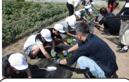
2・3年 ロロンの植え付け