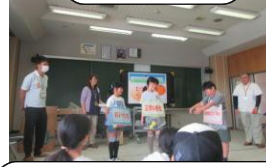
4年 認知症サポーター養成講座