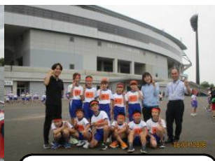
6年 陸上フェスティバル