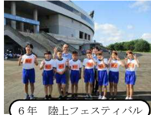
6年 陸上フェスティバル