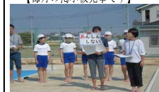
【今年は子供たちの手でピカピカプール】