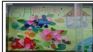
【毎月の掲示版見事です】