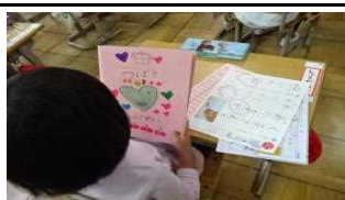
【初めてのポートフォリオ「つばさ」】