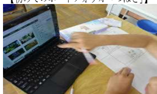
【タブレット、使いこなしています】