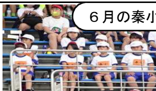
【陸フェスの勇姿。秦の誇りです】