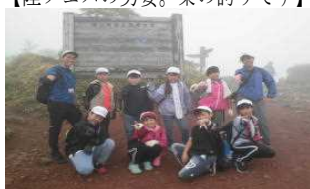
【林間学校 頂上制覇おめでとう】